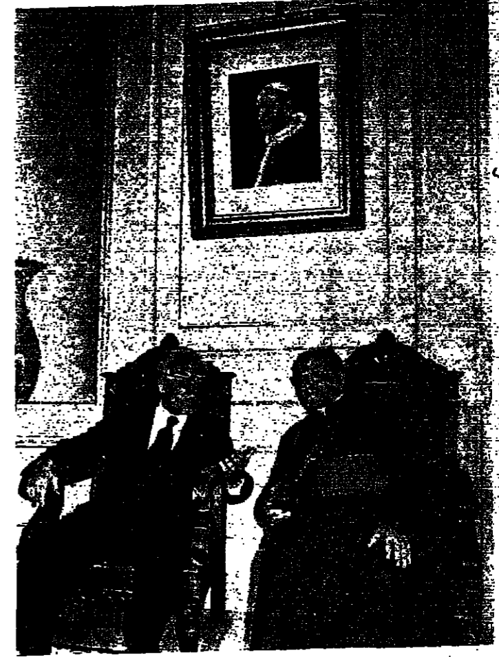
حيث بين الرئيس فرنجية والبطيريك خريش اناء اجتماعهما في امس البطيريك